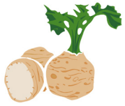
Rădăcini de țelină